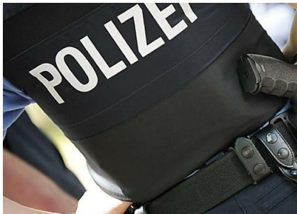
Savas K.: Ermittlungen zum Tod von Savas K. dauern an