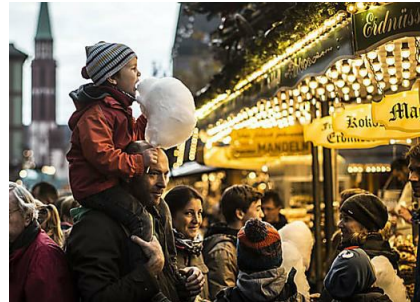
Veranstaltung: Viel Gedränge in der Weihnachtszeit