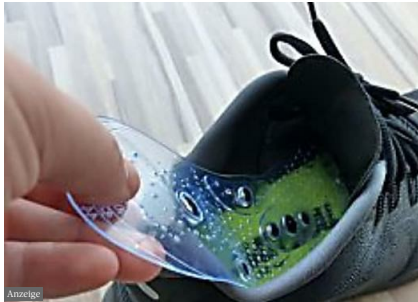
Dieser Trick gegen Rückenschmerzen erobert das Land www.smartertechtrends.com