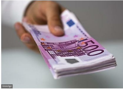
Schulden mit Negativzins loswerden smava - Kreditvergleich