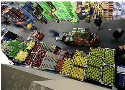
Kalbach: Angst um die Arbeitsplätze