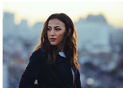
W-Festival 2019: Namika trifft Suzi Quatro beim W-Festival